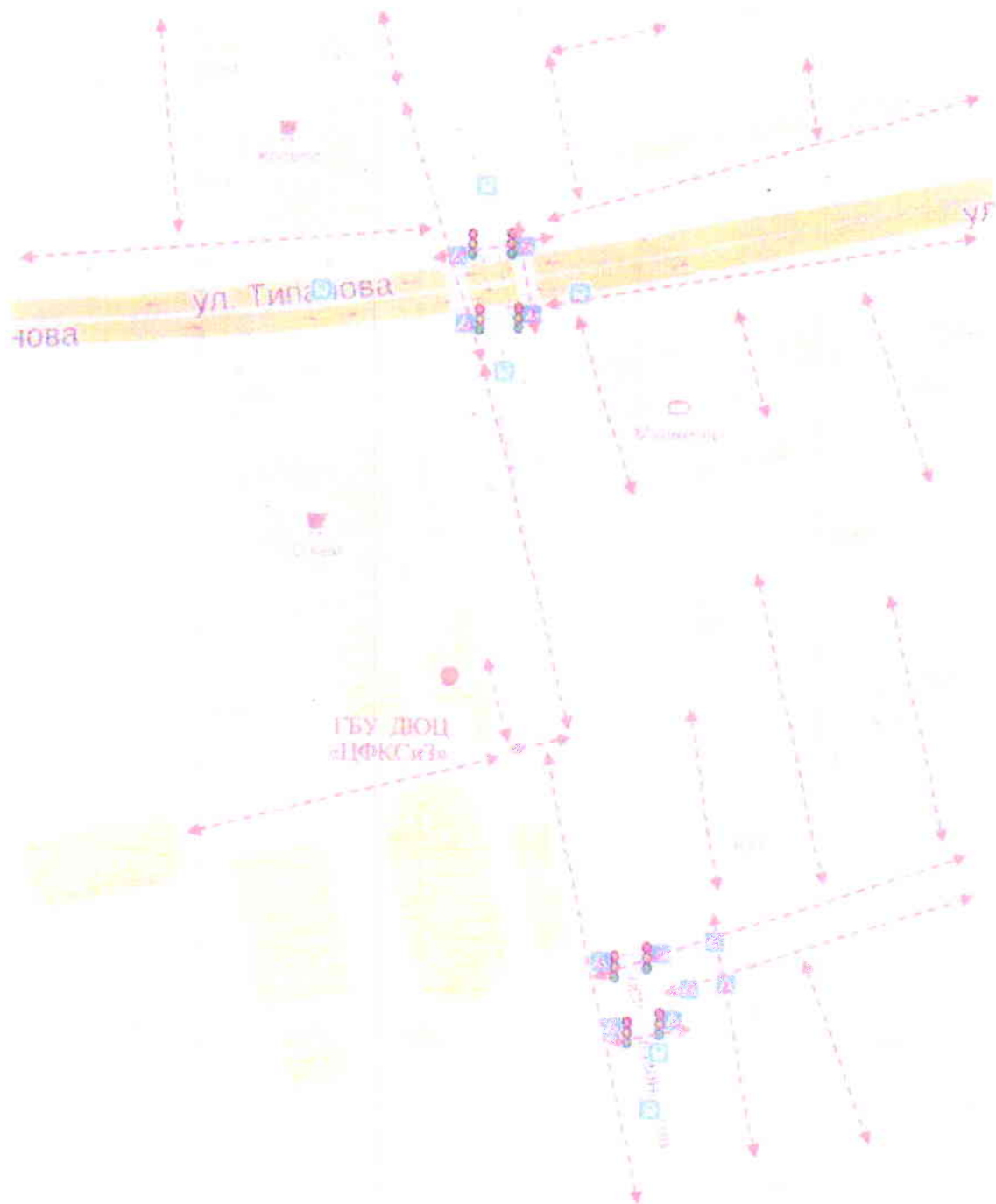
Схема организации дорожного движения в непосредственной близости от образовательного учреждения с размещением соответствующих технических средств, маршруты движения детей и расположение парковочных мест